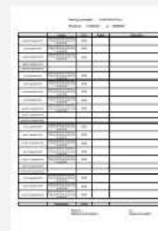
Planning d'auto-relevé hebdomadaire

Sélectionnez le type de planning que vous souhaitez générer.