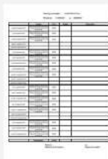
Planning d'auto-relevé mensuel