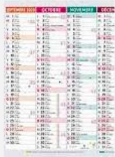
Planning prévisionnel annuel