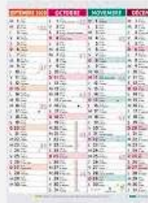
Planning réalisé annuel